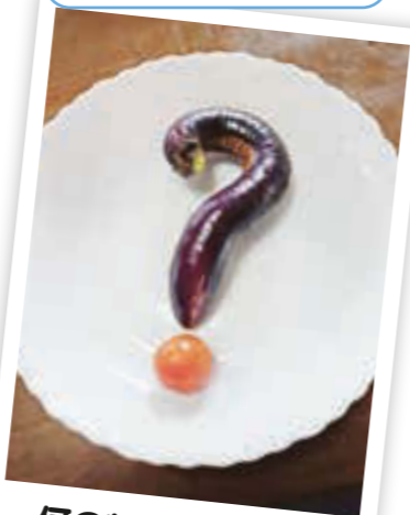
何の料理でしょう?