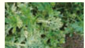
ハクサイダニによる被害

ハクサイダニは、体長約0.7mm、黒褐色で足は赤く、葉裏や地表をすばやく移動します。本虫は、夏場は休眠卵で雑草地の浅い土中で越冬し、秋に孵化して各種葉物野菜で被害が発生します。春には再び休眠卵を産卵し、越冬します。