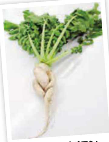
三つ編みダイコン