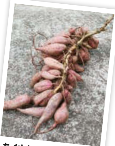
たくさん実ったサツマイモ